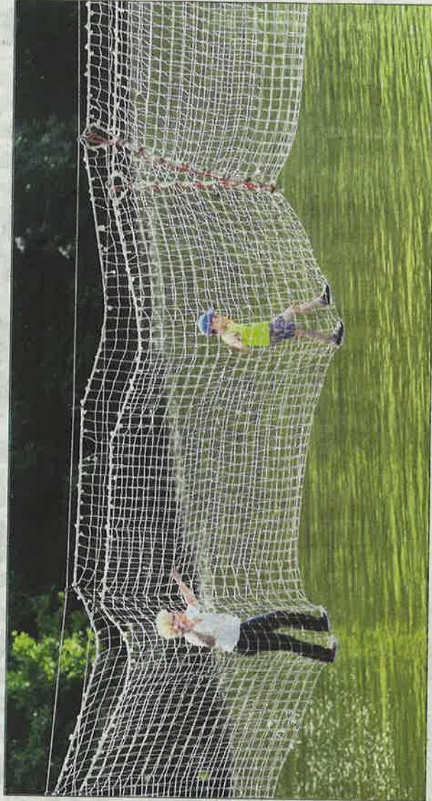
Petits et grands pourront profiter des installations sur l'Isle.

La manifestation, mise en sommeil depuis 2018 investira la Voie verte dimanche après-midi. L'occasion de découvrir un maximum d'activités sportives.