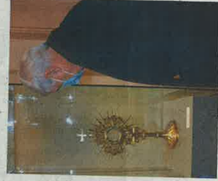
Un ostensorio dessiné par Viollet-le-Duc. PHILIPPE GREILLER

Calices, ciboires, ostensoirs, le Maap fait découvrir l'orfèvrerie religieuse des XIX e et XX e siècles