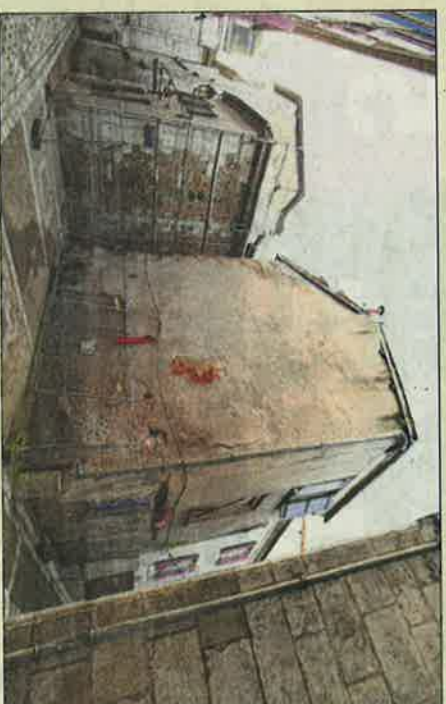
Un arrêté de péril concerne l'immeuble situé au 1, de la rue Roletrou. Une place ou un jardin pourraient voir le jour.