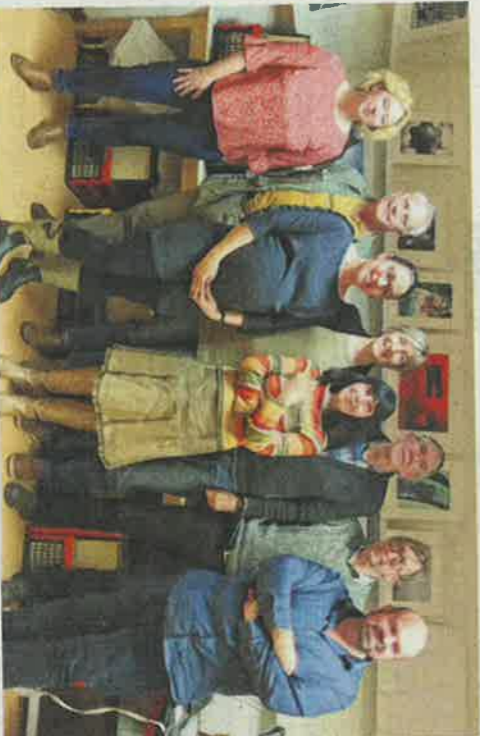
Les responsables de l'association lors de la dernière assemblée générale.

L'assemblée générale du Photo Club de Trélissac s'est déroulée il y a quelques jours. Les échanges ont été constructifs et de nombreuses idées ont été lancées concernant les sorties et les expositions de l'association.