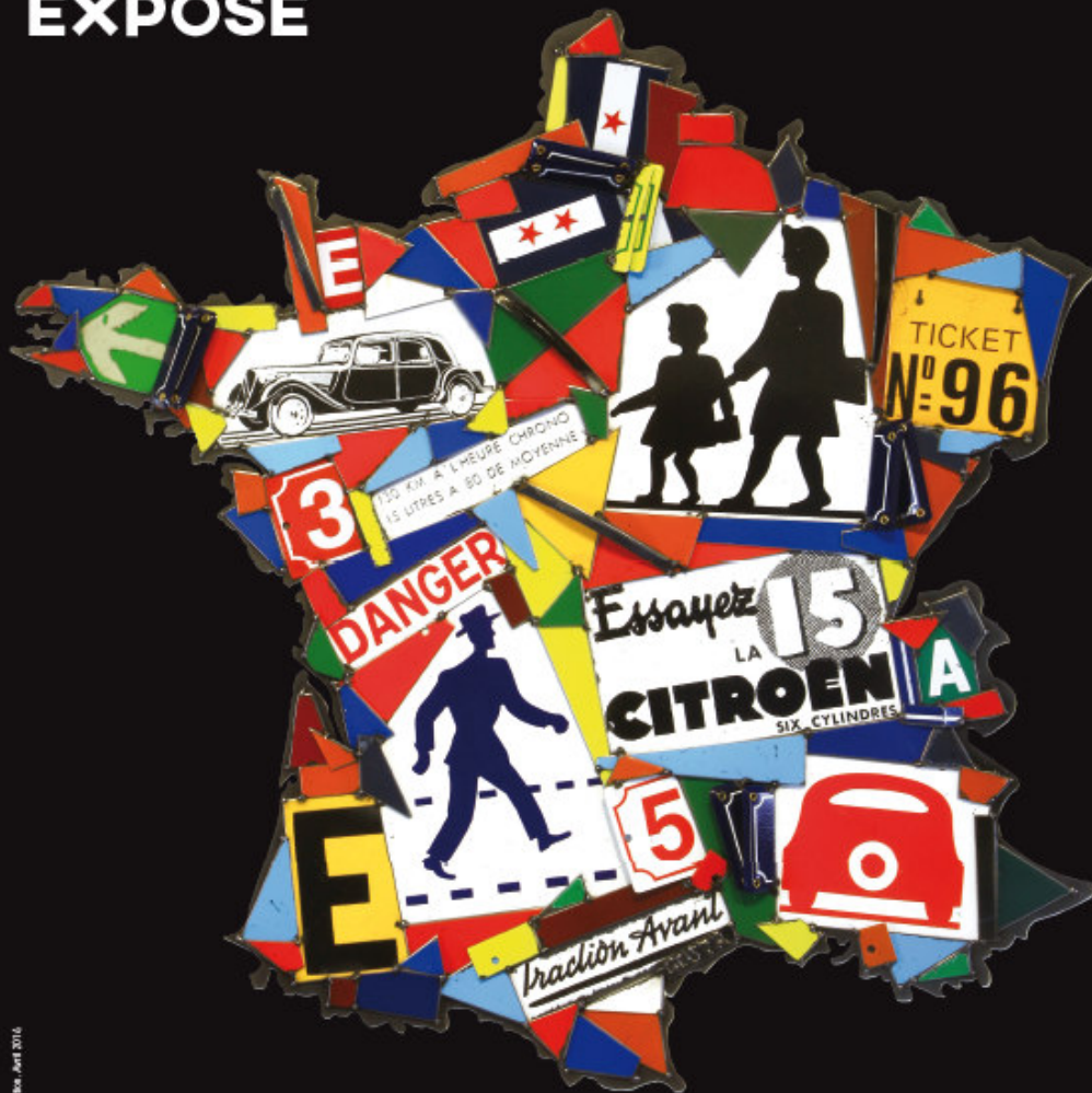
April 2016