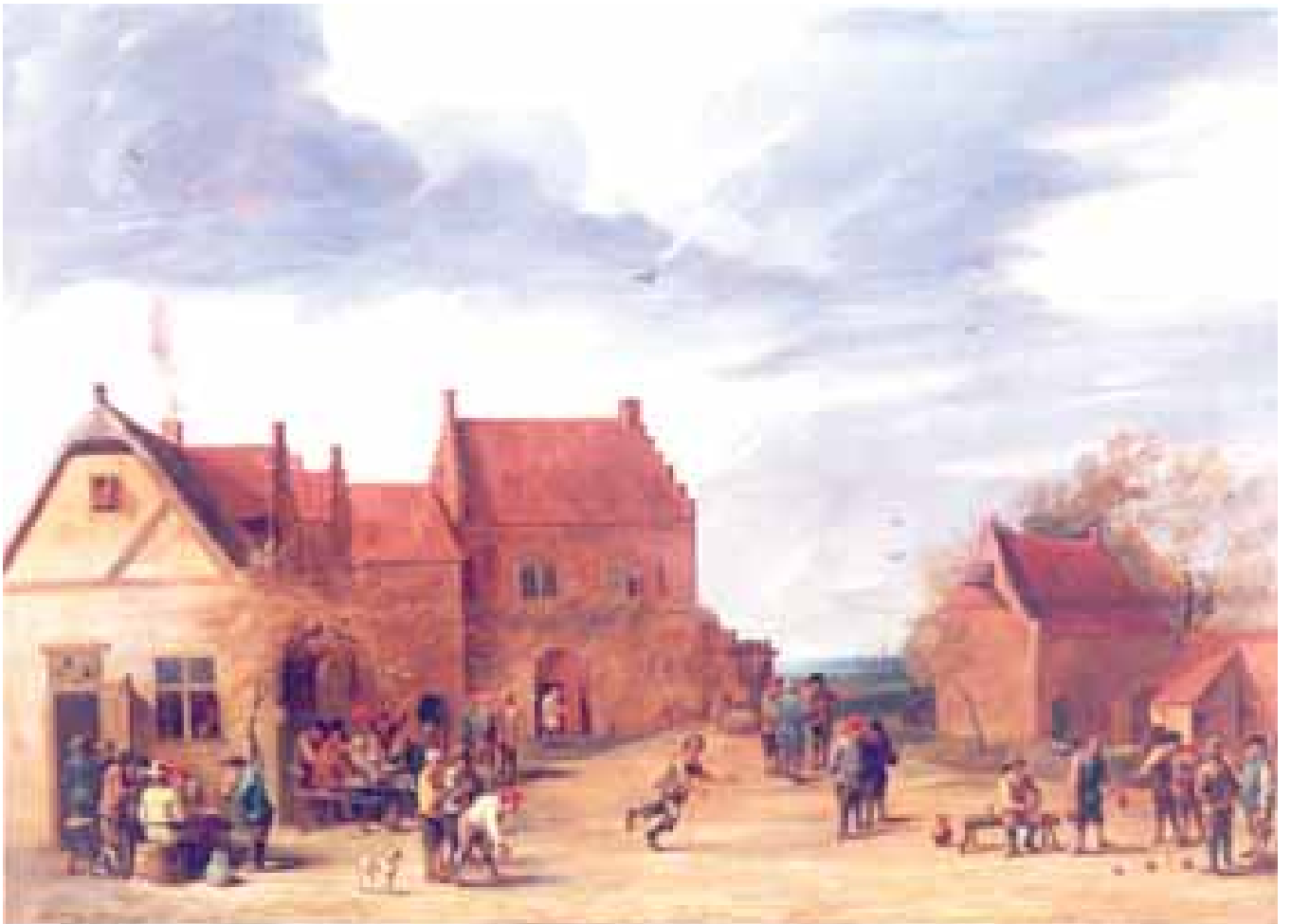
Jeu de boule sur la place du village, d'après David Teniers II (1610-1690), huile sur toile, coll. MAAP, Ville de Périgueux