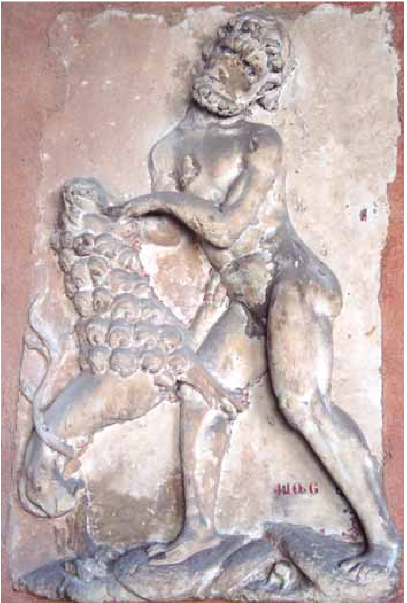
Hercule tuant le lion de Némée, bas-relief, 16 e siècle, coll. MAAP, Ville de Périgueux