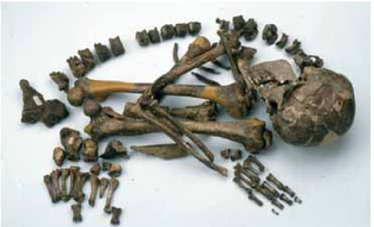
Squelette de l'homme de Chancelade, Homo-sapiens , magdalénien, coll. MAAP, Ville de Périgueux