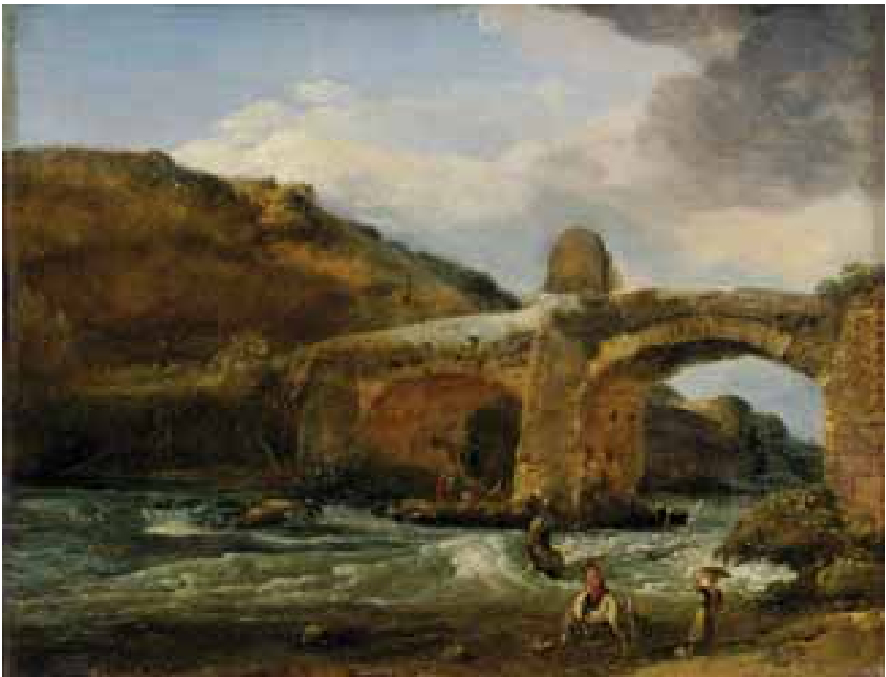
Le vieux pont sur le torrent, Hubert Robert (1733-1808), coll.MAAP, Ville de Périgueux