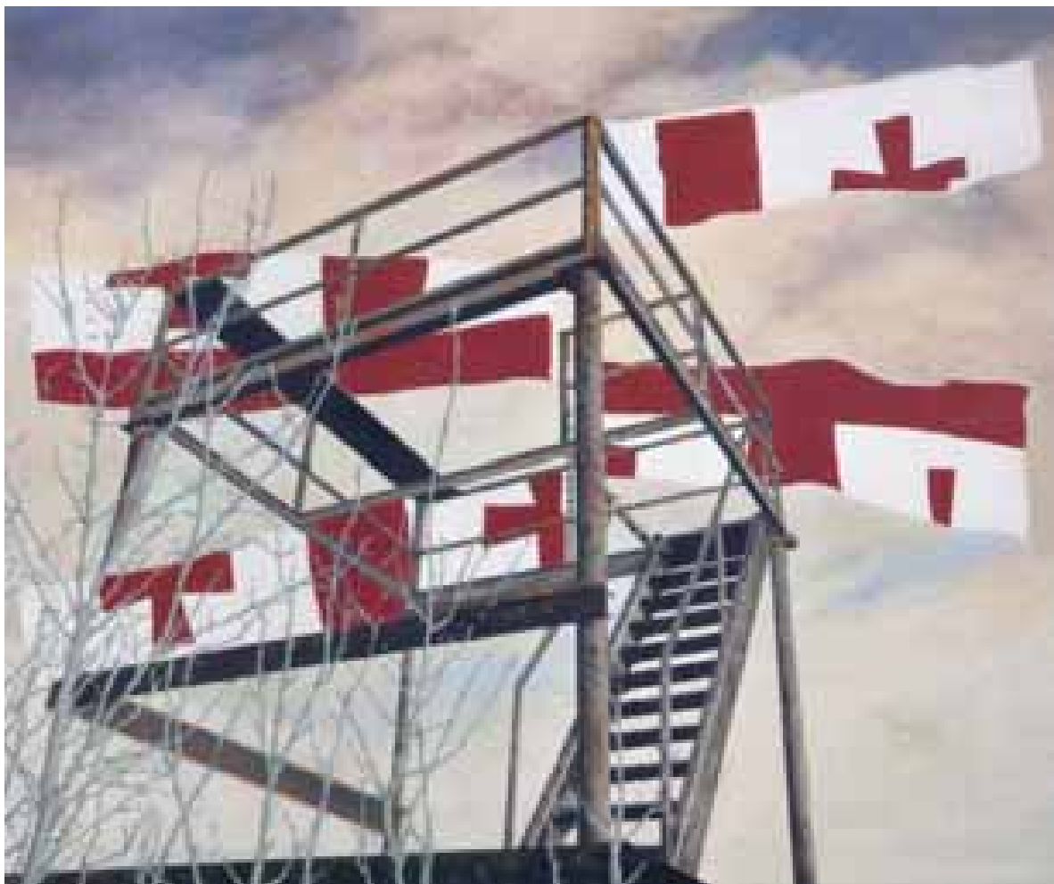
41°42' Nord / 44°47' Est, Fabrice Thomasseau, acrylique sur toile, 2009, coll. MAAP, Ville de Périgueux