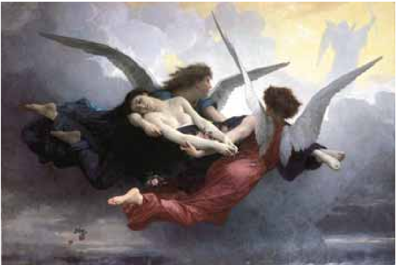
Une âme au ciel, William Adolphe Bouguereau (1825-1905), 1878, coll. MAAP, Ville de Périgueux