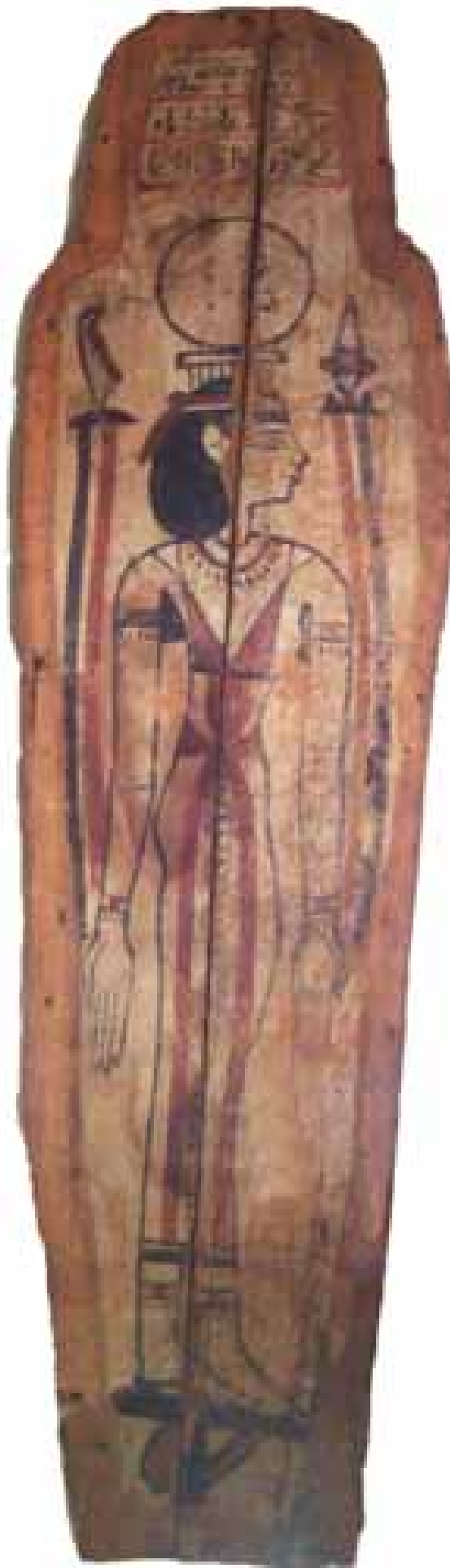
Fond du sarcophage de la dame Ka... (?) avec une représentation de Nout, déesse de la nuit, Egypte Coll. MAAP, Ville de Périgueux