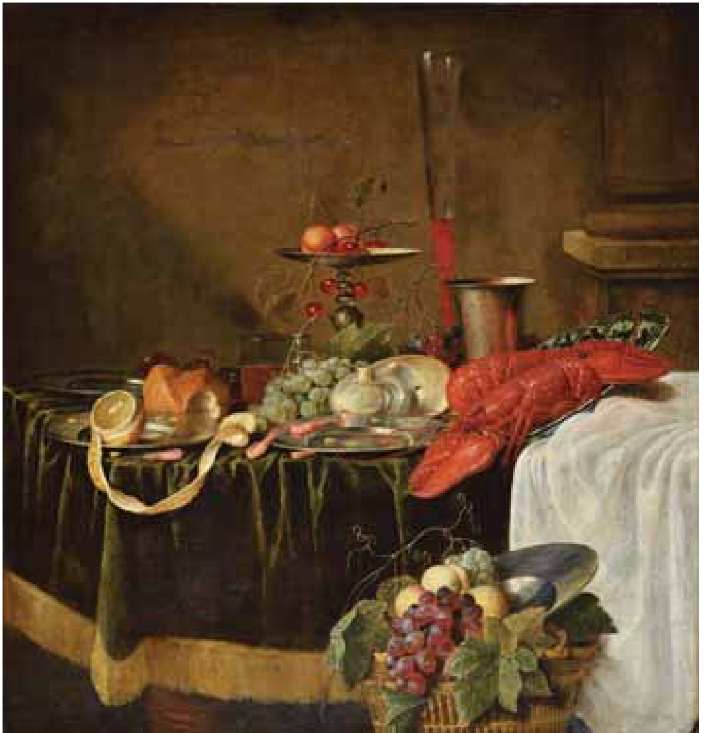
Vaisselle, fruits et crustacés sur une table, Jan Davidz de Heem (1604-1684), Hollande, coll. MAAP, Ville de Périgueux