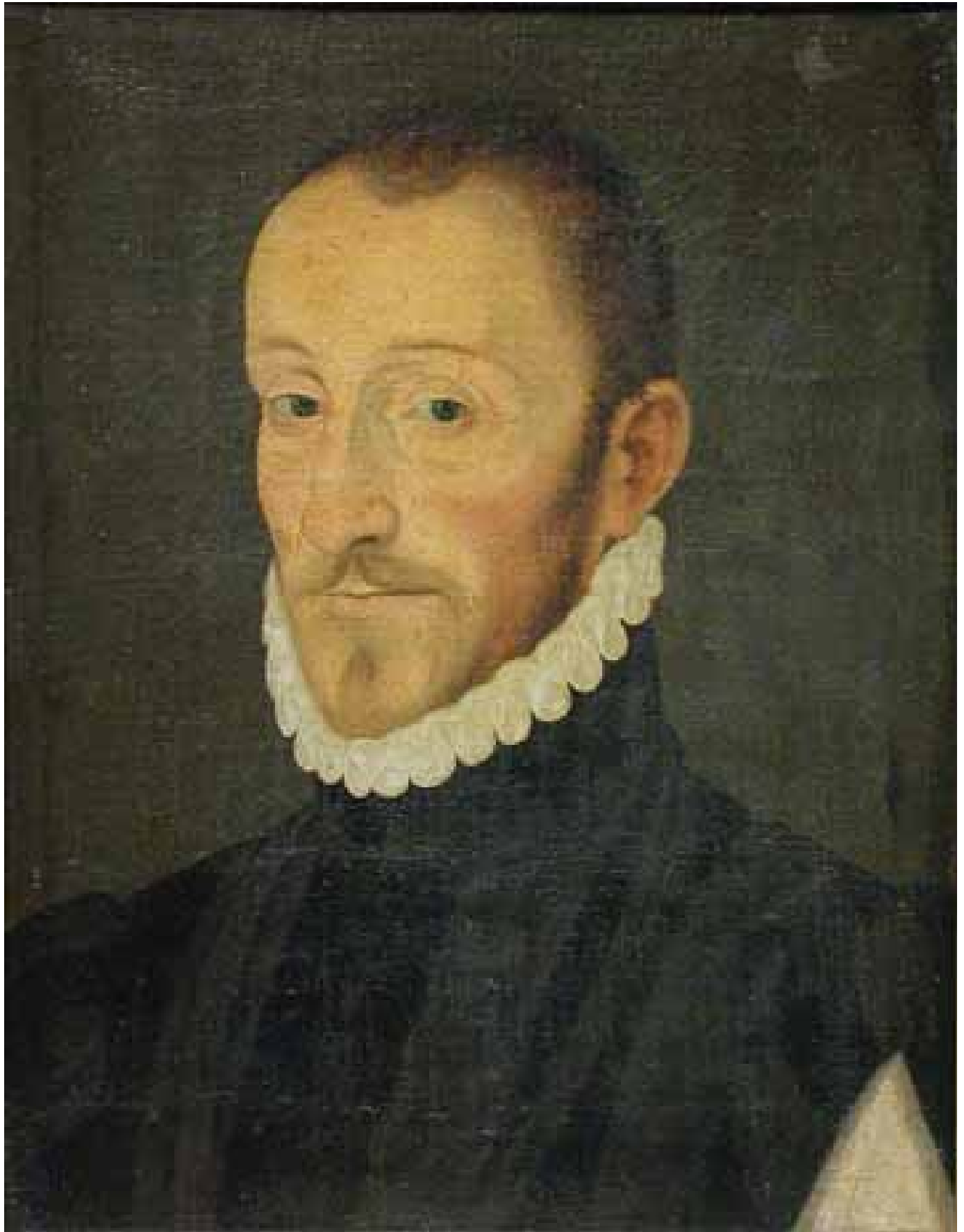
Pierre de Bourdeille (1543-1614), Ecole des Clouet, 16 ème siècle, coll. MAAP, Ville de Périgueux