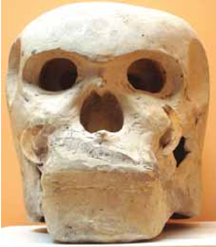
Masque rituel, Mud men, Papouasie Nouvelle Guinée, 20e, coll. MAAP, Ville de Périgueux