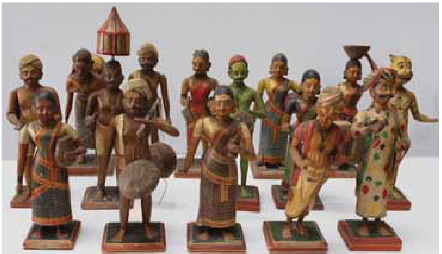
Figurines indiennes, Inde 19 ème siècle, coll.MAAP, Ville de Périgueux