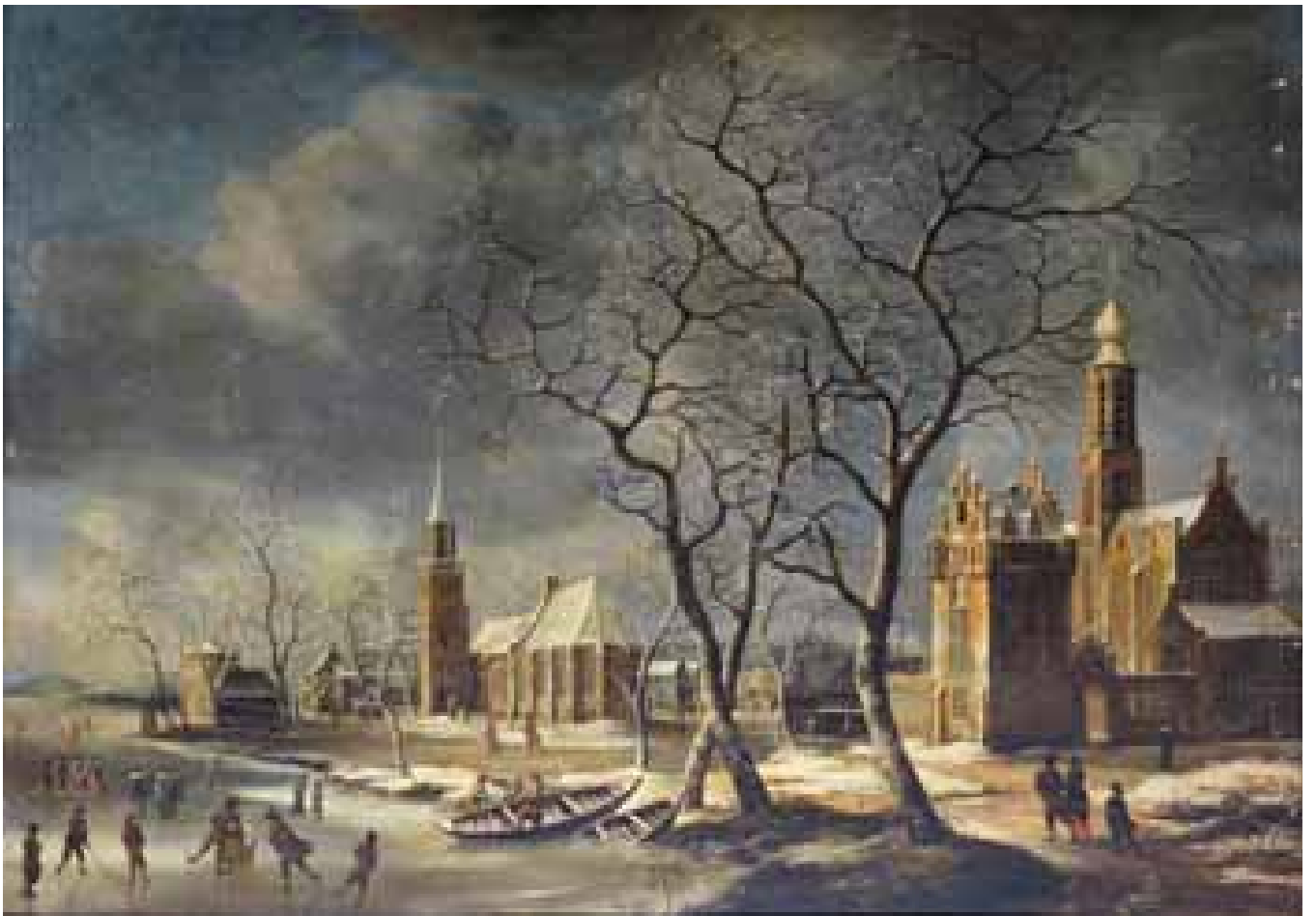
Vue d'un village sous la neige, Jan Abrahamsz Beerstraaten (1622-1666), coll. MAAP, Ville de Périgueux