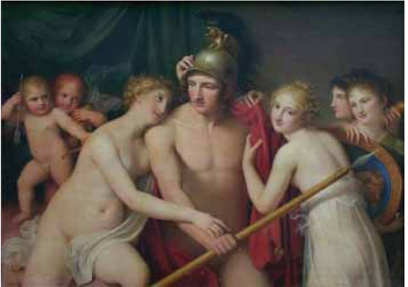
Mars désarmé par les Grâces, école de David (1748-1825)