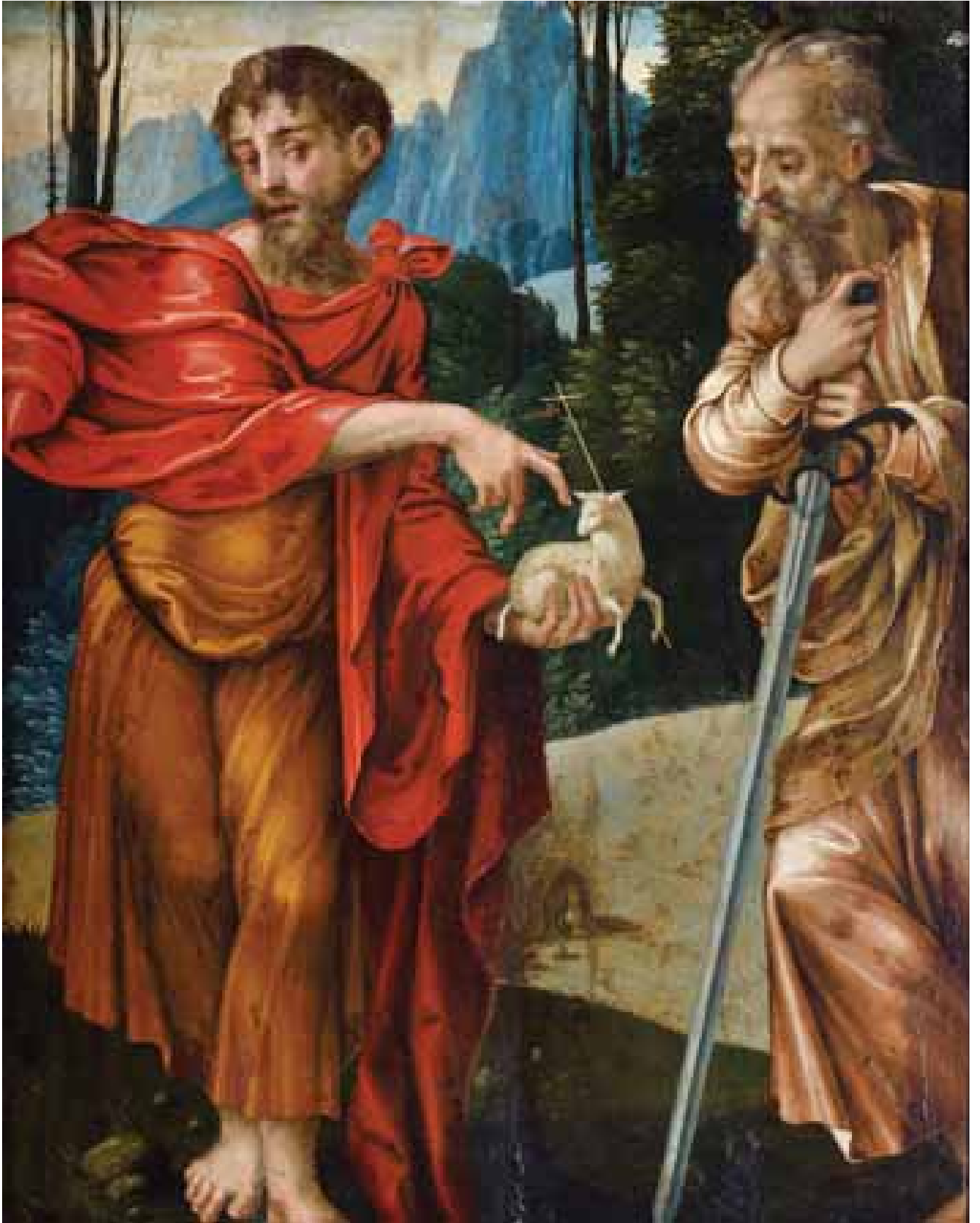
Saint Jean-Baptiste et Saint Paul, Luis de Morales (avt 1520-1586), Espagne, coll. MAAP, Ville de Périgueux