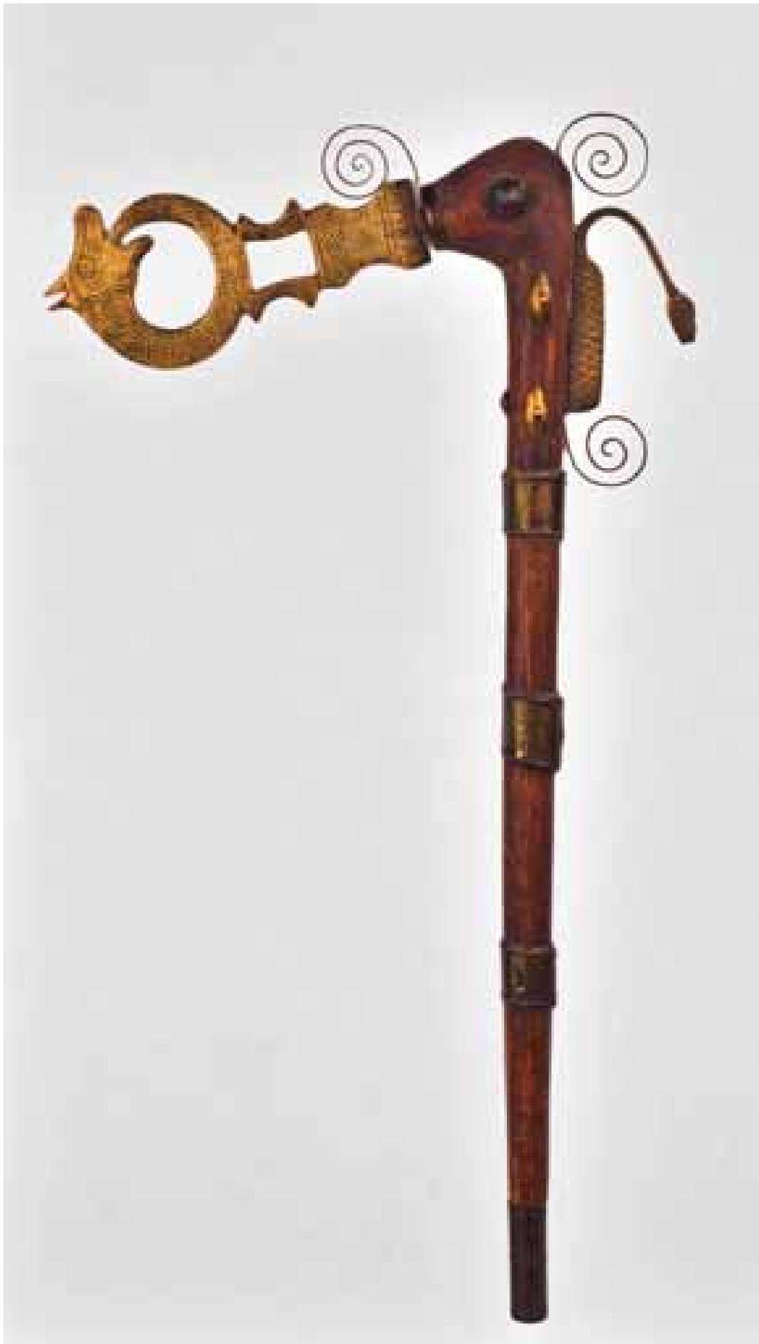
Récade, Bénin fin XIXème début 20ème, coll. MAAP, Ville de Périgueux