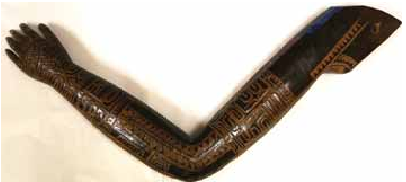
Bras tatoué modèle de tatoueur, Iles Marquise, fin 19 ème , bois gravé, coll. MAAP, Ville de Périgueux