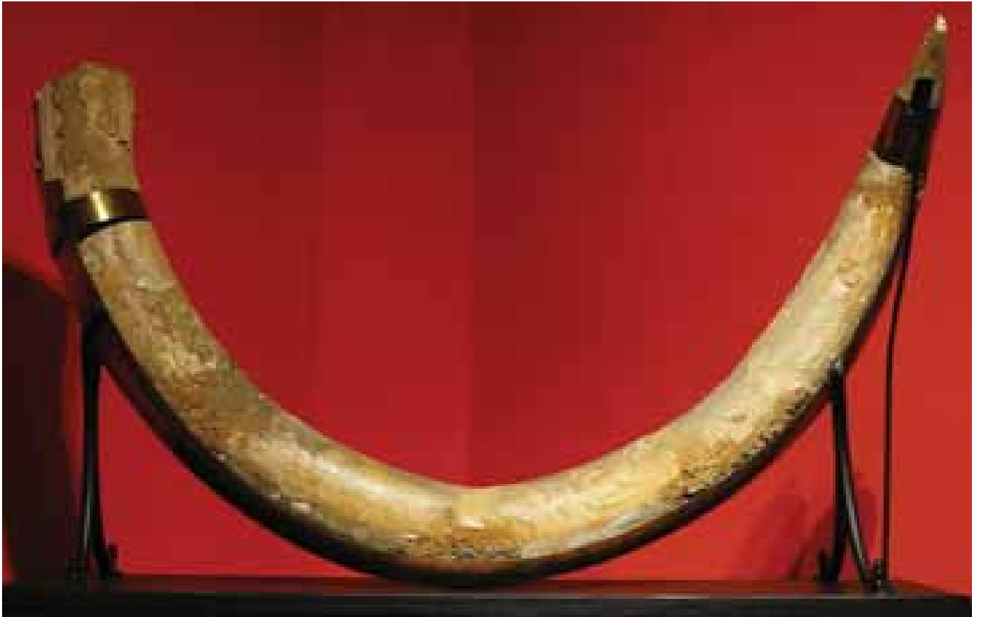
Dépense de mammoth, paléolithique, coll. MAAP, Ville de Périgueux