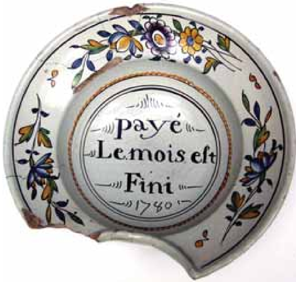
Plat à barbe, « payé » « le mois est fini », faïence, 18 ème siècle, coll. MAAP, Ville de Périgueux