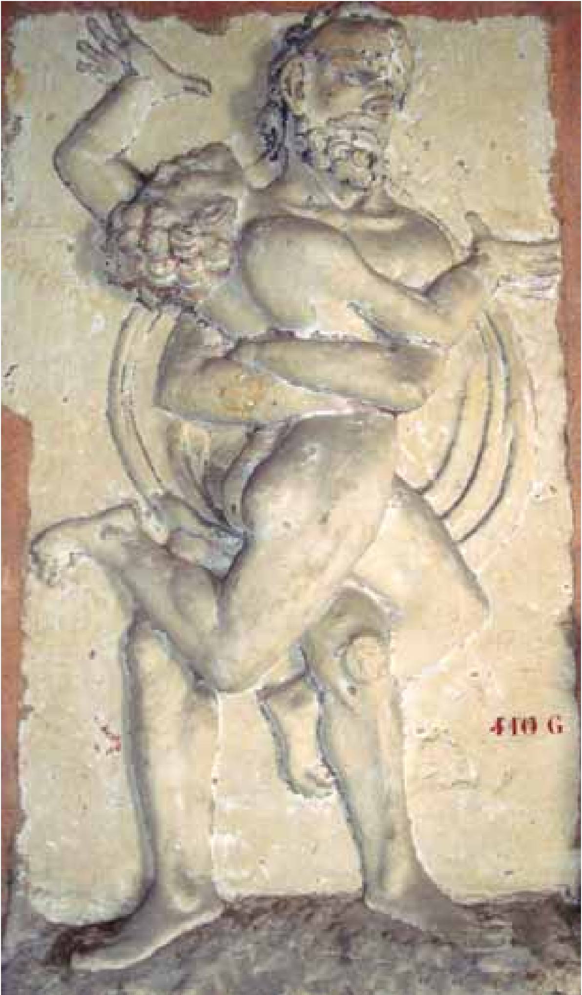
Hercule étouffant le géant Antée, XVe siècle, coll. MAAP, Ville de Périgueux