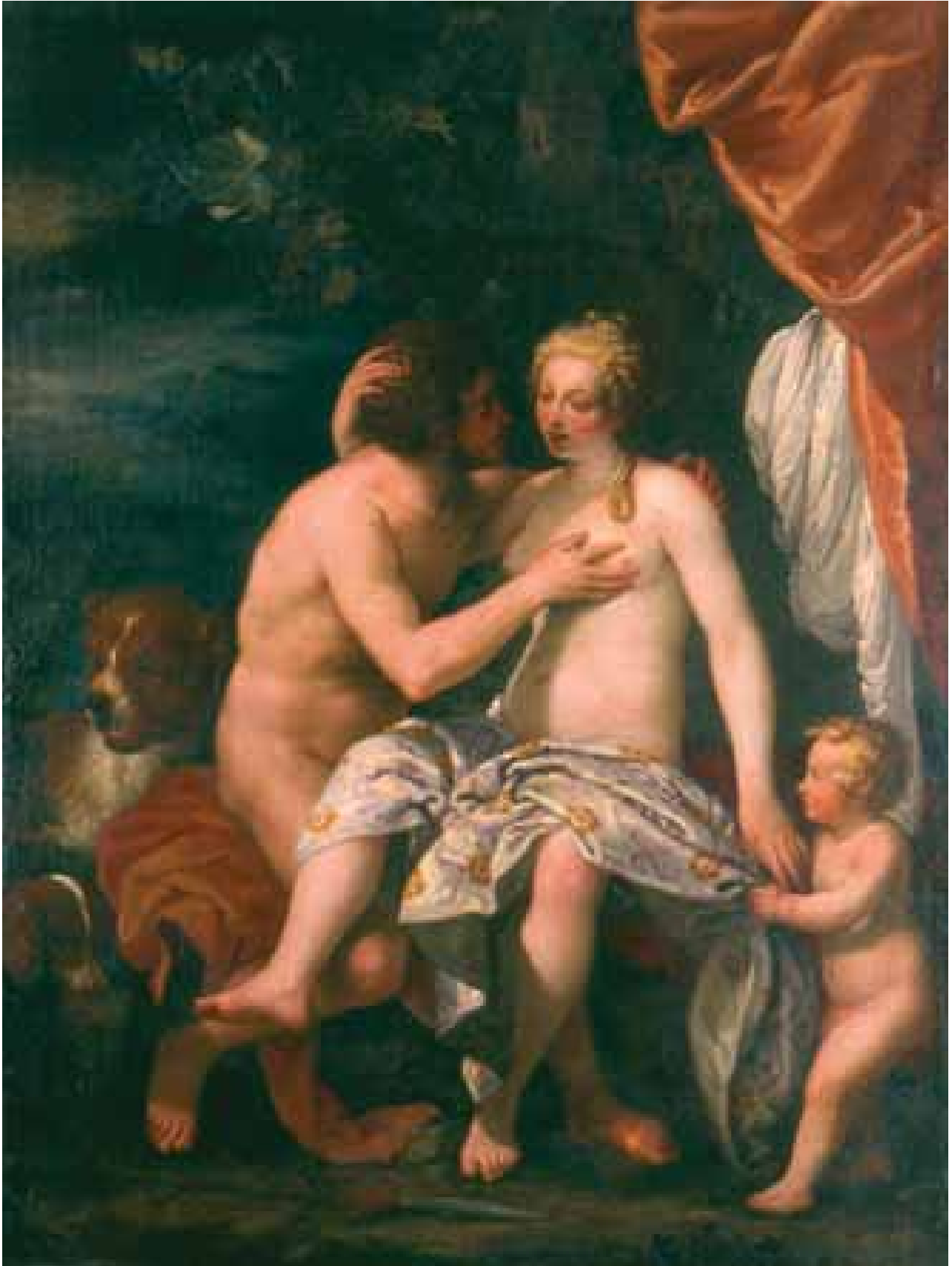
Vénus et Adonis, Ecole vénitienne, 17 ème siècle, dépôt de l'Etat, coll. Musée du Louvre n°852