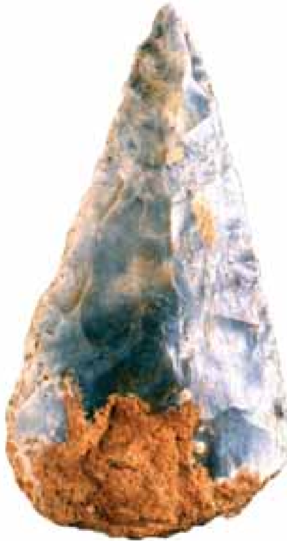
Biface, Acheuléen supérieur, Coll. MAAP, Ville de Périgueux