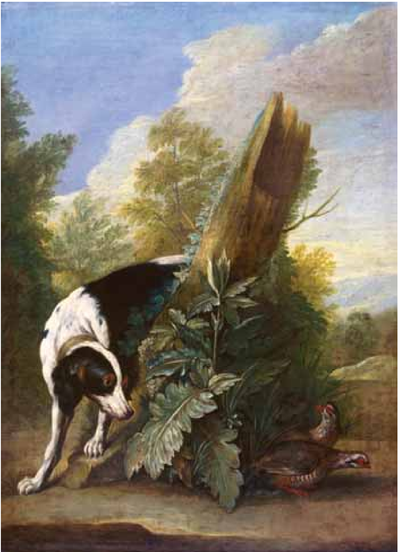
Epagneul arrêtant deux perdrix, Jean-Baptiste Oudry (1686-1755), coll MAAP, Ville de Périgueux