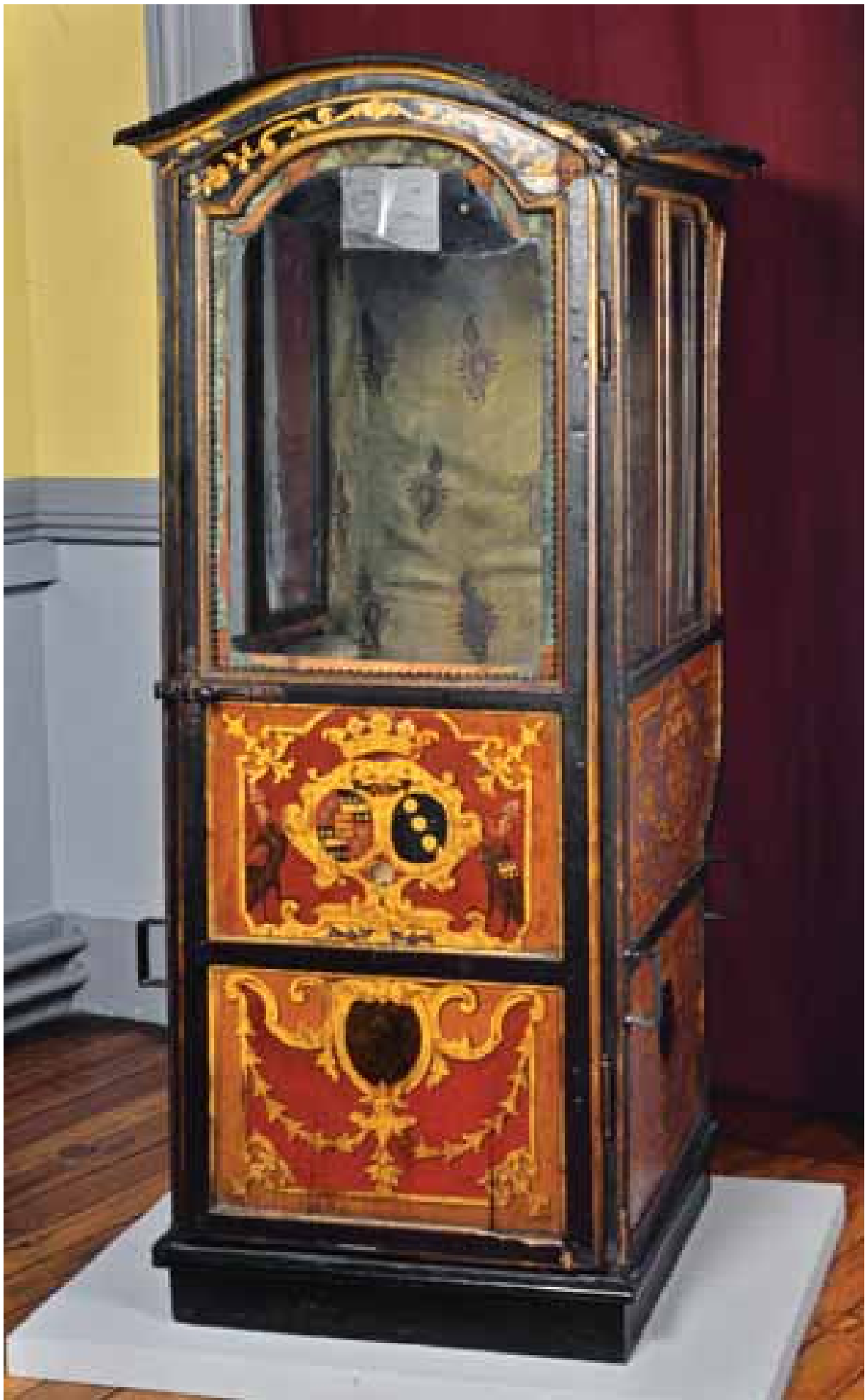
Chaise à porteurs, 18 ème siècle, coll. MAAP, Ville de Périgueux