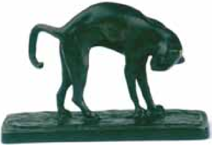
Chat, Théodore Alexandre Steinlen (1859-1923), coll MAAP, Ville de Périgueux