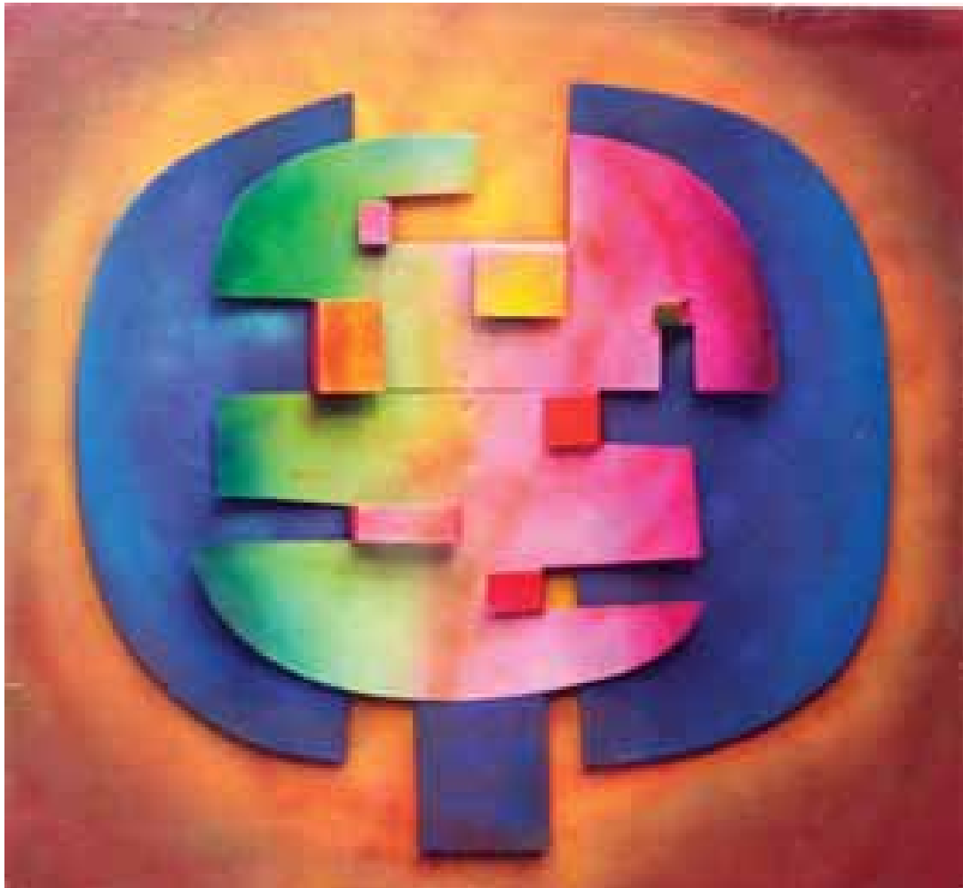
Fusion, Jean Chaintrier, coll. MAAP, Ville de Périgueux