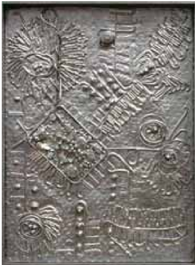
Sans titre 1968, Emma Reyes (1919-2003), coll. MAAP, Ville de Périgueux