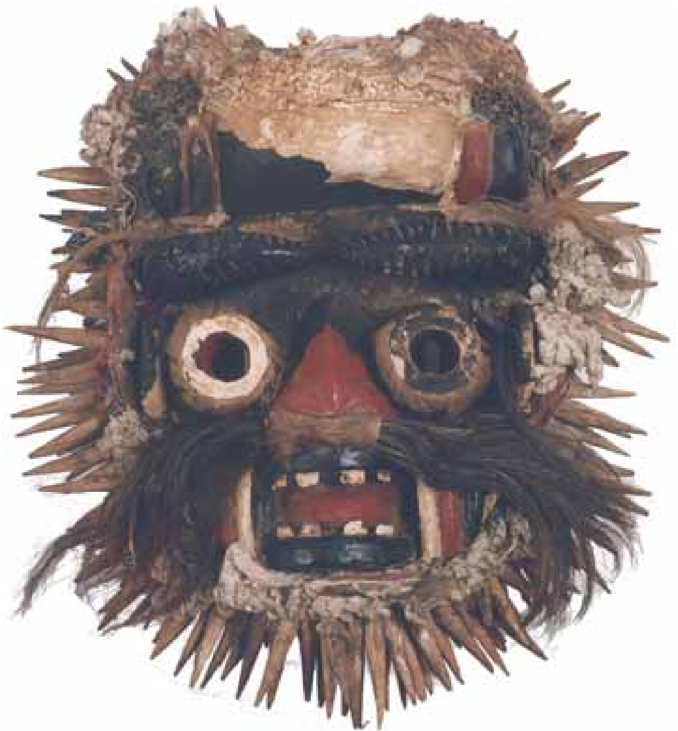
Masque Nguéré, Côte d'Ivoire, début 20e, coll. MAAP, Ville de Périgueux