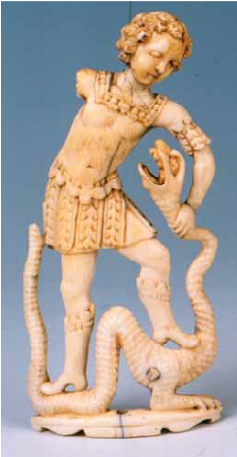
Saint Michel et le dragon, ornement d'un bâton de chantre, 16 e siècle, coll. MAAP, Ville de Périgueux