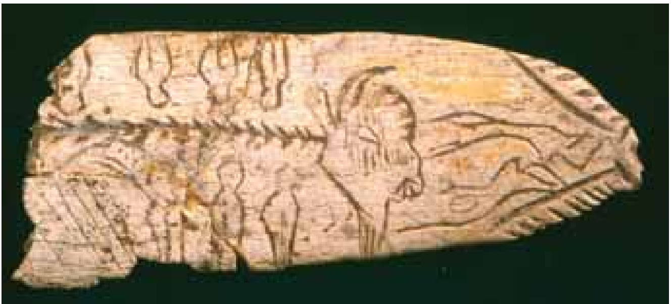
Pendeloque au bison, Paléolithique supérieur, coll. MAAP, Ville de Périgueux