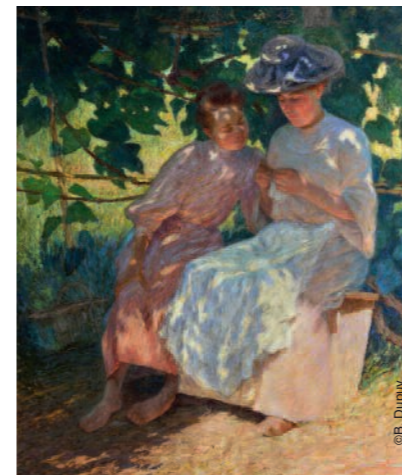
La leçon de crochet - Léon Félix

Het museum organiseert 4 tot 5 keer per jaar exposities die zijn gewijd aan hedendaagse kunstenaars en het optimaliseren van de collectie en de financiën in samenwerking met andere culturele instellingen en organisaties.